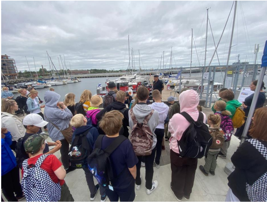
Itämeripäivän tapahtuma 25.8.22 Noblessnerissa – yhteistoiminnan ja kummitoiminnan päivä