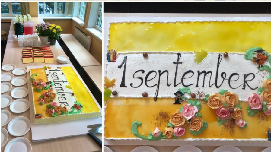
Tiedon ja viisauden päivän juhlintaa – oppimisen juhlapäivä