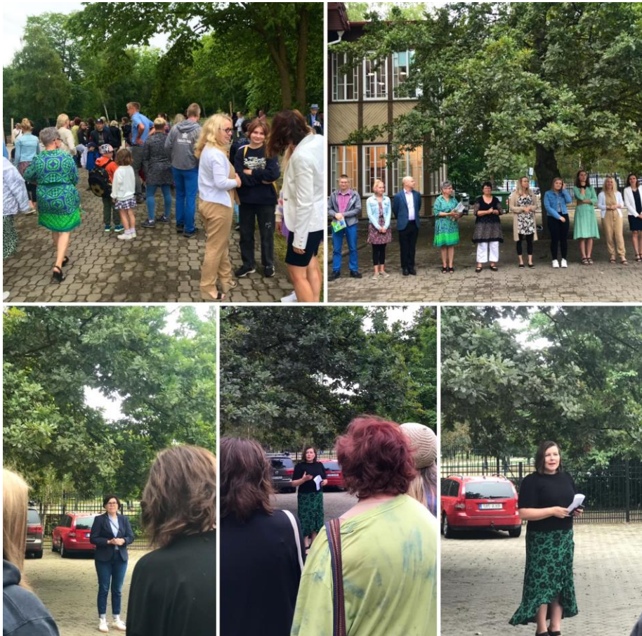
Ensimmäinen koulupäivä uudella koululla